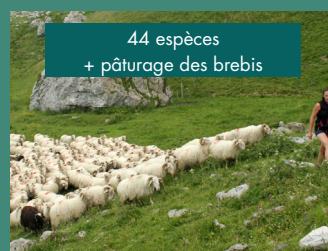
1 an après écobuage